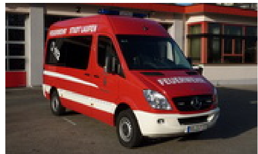
FFW Laufen Mehrzweckfahrzeug (MZF)