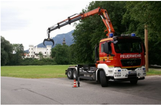
FFW Bad Reichenhall Wechselladerfahrzeug (WLF)