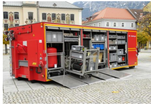
FFW Bad Reichenhall Abrollbehälter Gefahrgut