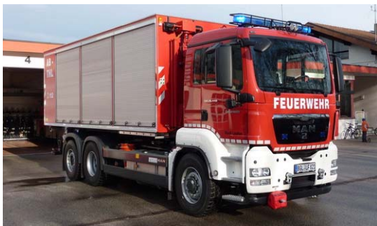
FFW Laufen Abrollbehälter Techn. Hilfeleistung (THL)