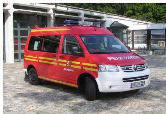
FFW Bad Reichenhall Mehrzweckfahrzeug (MZF)