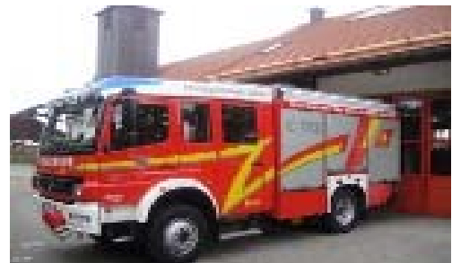
FFW Surheim Hilfeleistungslöschgruppenfahrzeug (HLF) 20/16