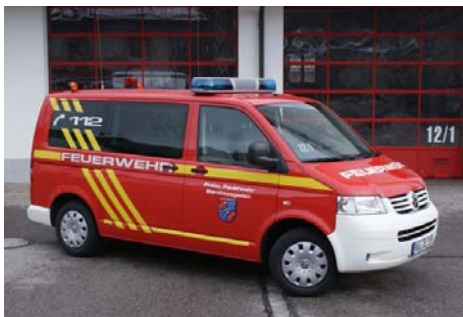
FFW Berchtesgaden Einsatzleitwagen (ELW 1)