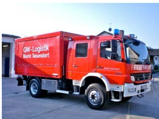
FFW Teisendorf Versorgungs-LKW